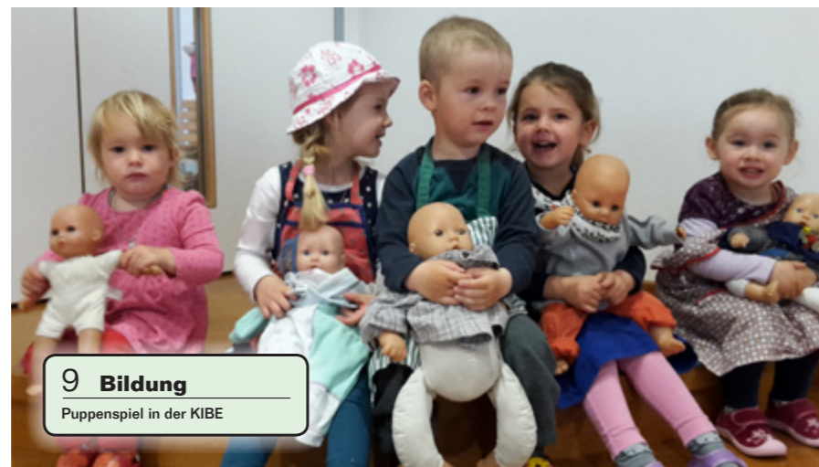
9 Bildung Puppenspiel in der KIBE