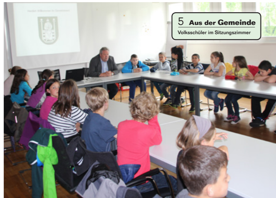
5 Aus der Gemeinde Volksschüler im Sitzungszimmer