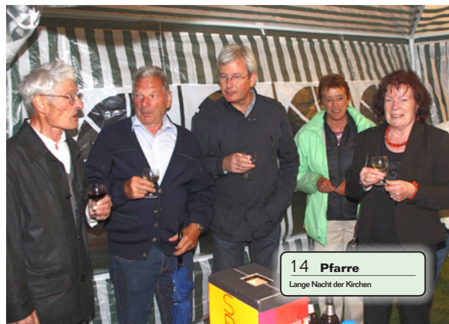
14 Pfarre Lange Nacht der Kirchen